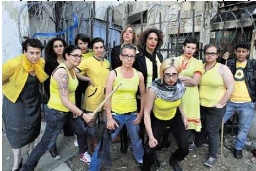
"האזור מופקר והחוק לא נמצא כאן כדי להגן על הנשים"

למרבה הצער, המציאות הקשה שבה חיות תושבות האזור אינה מסתכמת בצרחות, חיכוכים והבהלות. היא כוללת הטרדות מיניות, תקיפות ומקרי אונס. חלק מהמקרים, בהם אונס הקשישה בת ה-83 לפני ארבעה חודשים ותקיפה מינית של ילדה ביד אליהו לפני כחודש על ידי אפריקאים, מדווחים למשטרה ומפורסמים באמצעי התקשורת, אך רובם, חוששת קוי, נרשמים אך ורק בפרוטוקול הזיכרון של הקורבנות.