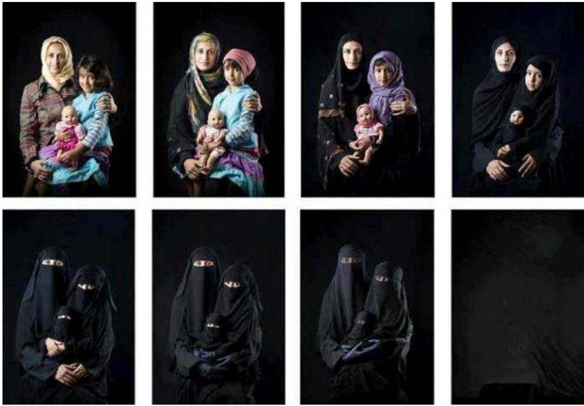
עבודה של אומנית אירנית. נשים שהולכות ונמוגות

מהנעשה ברמת הארגון העולמי תאריכים בחיי הפדרציה: